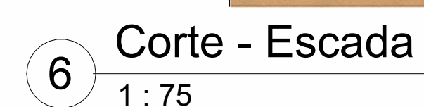
6 Corte - Escada 1 : 75