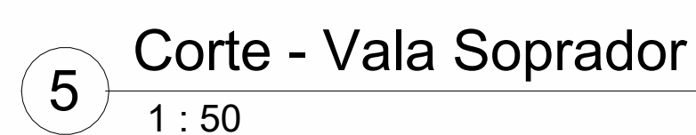
5 Corte - Vala Soprador 1 : 50