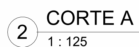
2 CORTE A 1 : 125