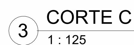
3 CORTE C 1 : 125