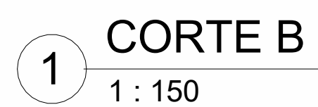
1 CORTE B 1 : 150